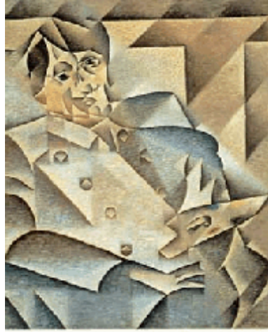
Juan Gris, portret van Picasso 1912