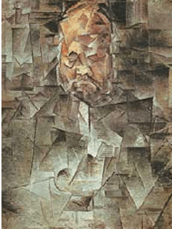
Picasso, portret van Vollard 1910