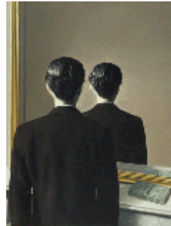
Magritte, Spiegel 1937