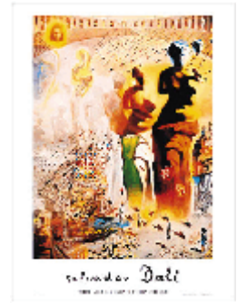
Dali, poster Toreador