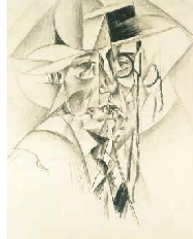
Severini, zelfportret 1912