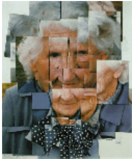
David Hockney, mother 1985