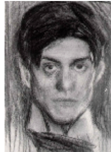
Pablo Picasso 1899