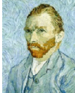
Vincent van Gogh 1889